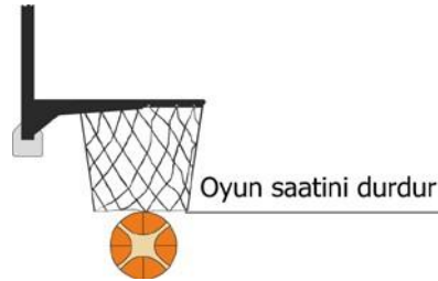
Diyagram 1 Sayı

(b) oyun saati 4. periyotta ya da bir ekstra periyotta 2:00 dakika gösterdiğinde, top, Diyagram 1'de gösterildiği gibi açıkça sepetten geçtiğinde oyun saati durdurulacaktır.