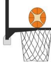
Diagram 2 Çemberle temas halindeki top

31-15 Açıklama: Bir savunma ya da hücum oyuncusu tarafından müdahale, sahadan bir atış sırasında top, çemberle temas halindeyken ve hala sepete girme olasılığı varken, bir oyuncu sepete ya da arkalığa temas ettiğinde, oluşur.