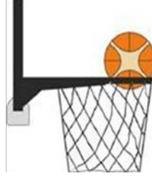
Diyagram 3 Sepetin içindeki top

31-20 Açıklama: Bir savunma oyuncusu top sepetin içindeyken topa temas ederse bu bir müdahale ihlalidir.