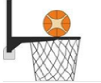
Diyagram 2 Çemberle temas halindeki top

31-15 Açıklama: Bir atış sırasında top çemberle temas halindeyken ve hala sepete girme olasılığı varken bir oyuncu sepete ya da arkalığa temas ettiğinde, bir savunma ya da hücum oyuncusu tarafından müdahale oluşur.