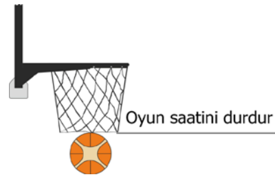
Diyagram 1 Sayı

(b) oyun saati 4. periyotta ya da bir ekstra periyotta 2:00 dakika gösterdiğinde, top, Diyagram 1'de gösterildiği gibi açıkça sepetten geçtiğinde oyun saati durdurulacaktır.